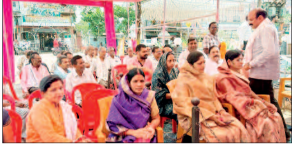
हरिभूमि न्यूज ►► नवापारा-राजिम

मंगलवार को शहर के मेन रोड चौक में साहू समाज ने दानवीर भामाशाह की जयंती बड़े ही धूमधाम और उत्साह के साथ मनाई। इस अवसर पर आयोजित समारोह में समाज के लोगों की भागीदारी देखने को मिली। कार्यक्रम में विभिन्न वर्गों के लोगों ने बढ़-चढ़कर हिस्सा लिया और दानवीर भामाशाह के व्यक्तित्व एवं कृतित्व को याद किया। कार्यक्रम की शुरुआत भामाशाह के प्रतिमा पर माल्यार्पण एवं दीप प्रज्वलन के साथ हुई। वक्ताओं ने अपने संबोधन में भामाशाह के जीवन पर प्रकाश डालते